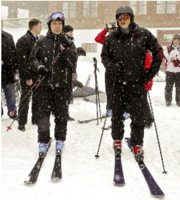
Дмитрий Медведев и Ильхам Алиев

Спортивная стилистика власти и элиты – это не спорт, а продолжение политики и не более того. Если бы первое лицо играло в шахматы, то все были бы шахматистами. Был бы он любителем кино, все тут же перекалифицировались бы в киноманов. Но получилось так, что выбор пал на спорт, на определенные его виды. В конце концов, спорт – это просто и понятно.